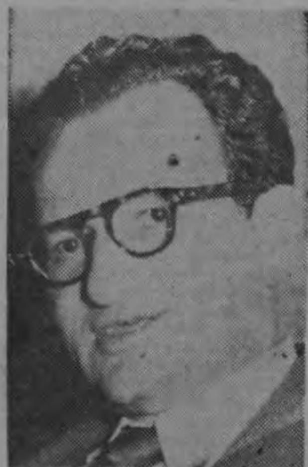
MINISTRO TOSSI ...drástica investigación...