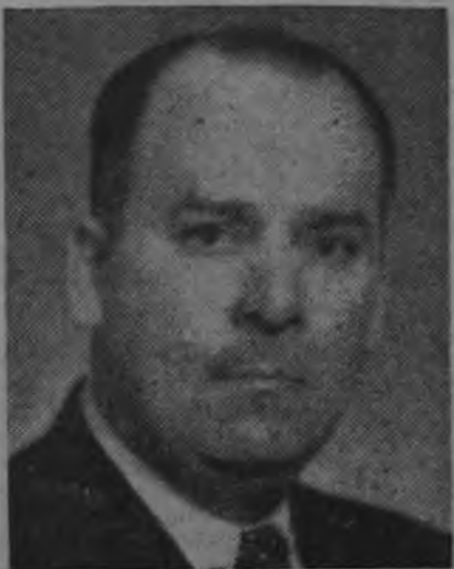
Ministro VALVERDE VEGA ...no conoce del asunto...