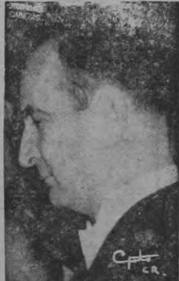
PRESIDENTE FIGUERES ...a inaugurar más obras...