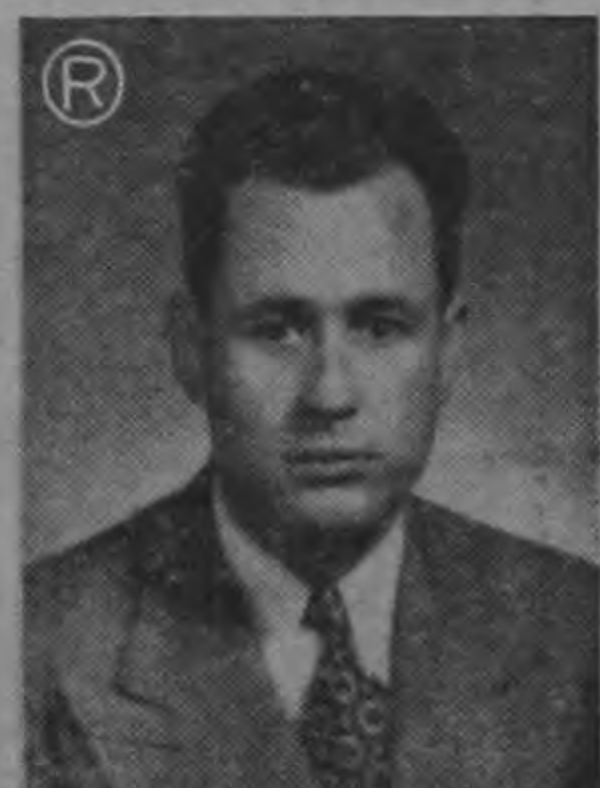
MINISTRO FALLAS ...proyecto ley trascendental...